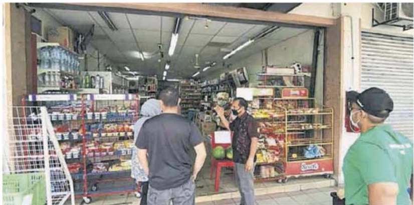
■杂货店受提醒保持1公尺社交距离。

市议会执法人员当场充公商贩的电子烟，同时指示有关食肆立即关店，在管制令期间，食肆只能提供打包服务。