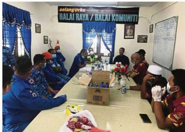
A meeting between Kampung Dato' Abu Bakar Baginda MPKK members and the Civil Defence Force to discuss standard operating procedures on aid distribution during the MCO.

All 50 families in this community were already receiving aid from the Indonesian Embassy but some breadwinners had fallen ill and