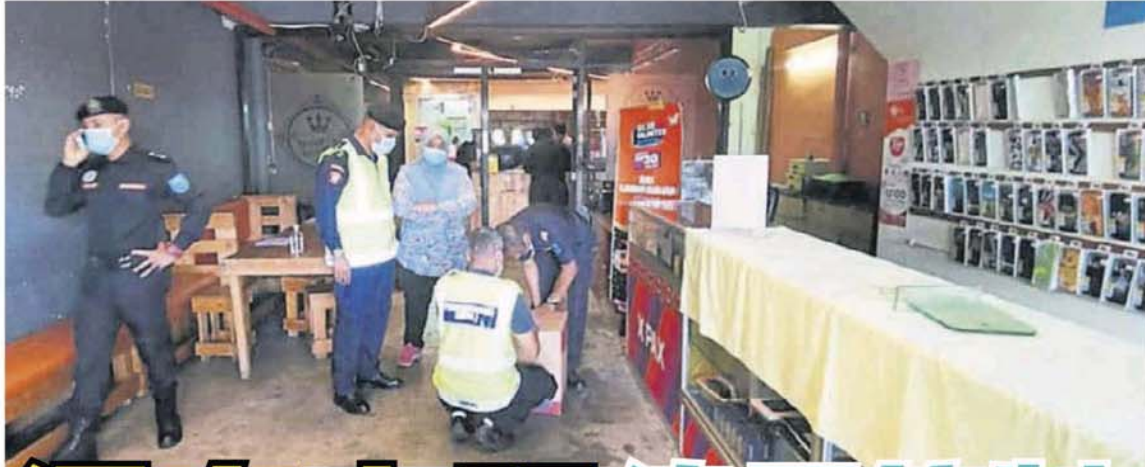
（照取自加影市议会面子书） 执法人员充公违例营业的商店商品。