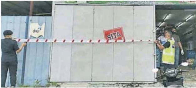
理发店。 市议会查封锡米山一间