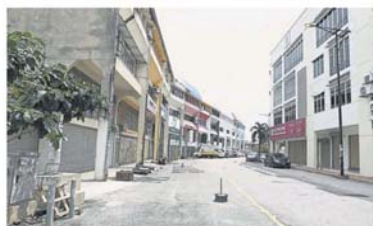
大部分商业活动暂停，路面不见垃圾踪影。