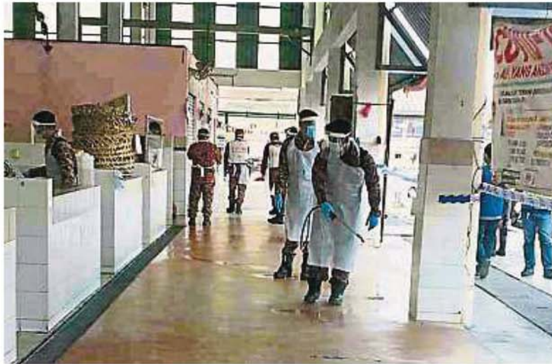
消拯局人员在4月6日在美嘉花园巴刹进行消毒。