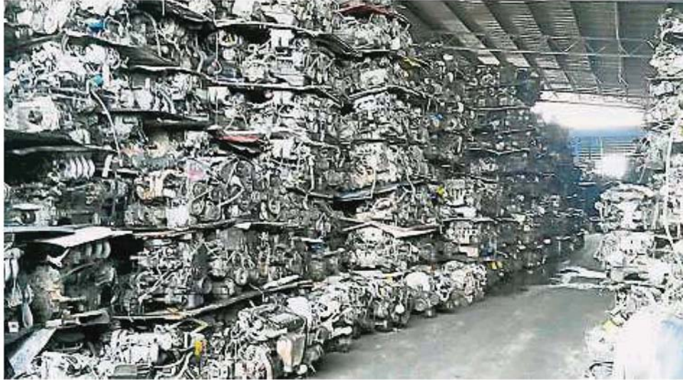
逾80%會員有涉及二手汽車零件的進出口貿易，行管令令會員苦不堪言。

(吉隆坡14日訊) 馬來西亞自動 車再循環公會吁請府放寬管制令期間 二手汽車零件行業營業申請，讓全馬上千家業者 能獲得營業准證，以減緩公司在停頓運作將近一 個月所帶來的巨大經濟打擊。