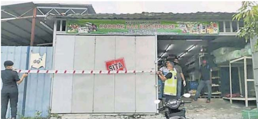
加影市议会查封擅自营业的理发店。

(加影 14 日讯) 外劳擅自开理发店营业，早上有大批顾客光顾，不过下午就被加影市议会查封了。