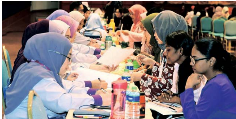
Sesetengah IPTS sepatutnya sudah menerima kemasukan penuntut dan memulakan pembelajaran bermula bulan lepas.

Pendapatan IPTS berkurang ekoran hadapi kekangan untuk tarik pelajar baharu