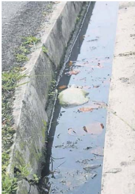
沟渠积水,是导致黑斑蚊滋生的因素之一。(档案照)

灵市20区的组屋也是骨痛热症黑区,疫情已维持122天,累计病例达96宗;至于雪州的骨痛热症黑区,则来自乌鲁雪兰莪县、八打灵县、乌鲁冷岳县、瓜拉冷岳县、巴生县、鹅唛县及雪邦县;吉隆坡的黑区则来自蕉赖及布城等地区。