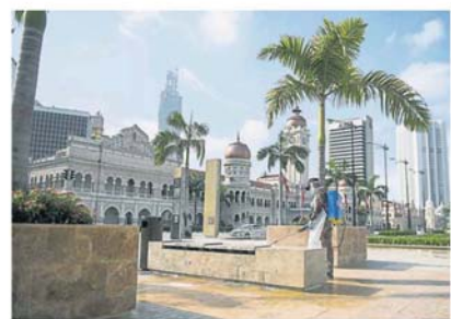
自然花乐员工如常进行卫生工作，独立广场环境更整洁，天空也因为少了废气而更蔚蓝。

巴生河则横跨巴生、瓜冷、雪邦、八打灵、吉隆坡、乌冷及鹅麦县，共有 253 支流，加上吉隆坡市政厅在 6 年前着手推动“生命之河”计划，河流污染情况获改善。