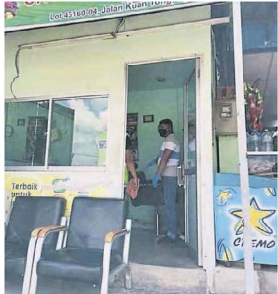
理发店重开遭取缔。