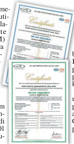
Pensijilan 9001:2015 dan 14001:2015 yang diterima oleh KDEBWM.

Katanya, pensijilan itu diberikan kepada Ibu Pejabat KDEBWM serta 12 cawangan iaitu Klang, Ampang, Selayang, Sabak Bernam, Hulu Selangor, Kuala Selangor, Kuala Langat, Petaling Jaya, Subang Jaya, Sepang, Kajang dan Shah Alam dengan diperakui pensijilan bagi skop kutipan sampah domestik.