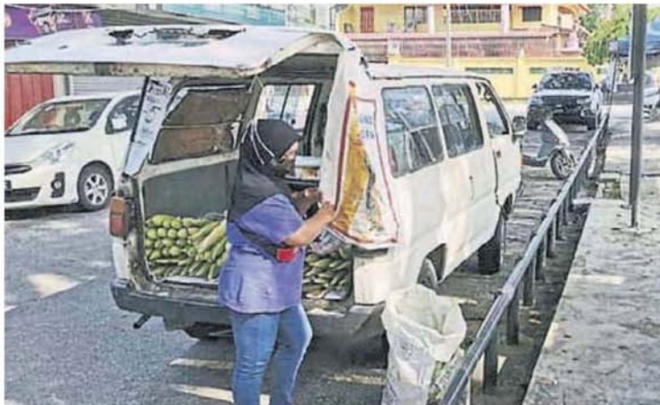
小贩还在路边卖玉蜀黍。