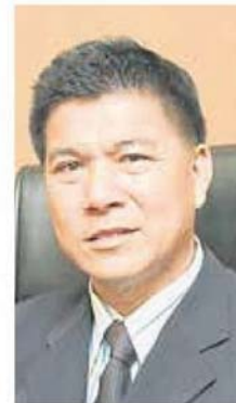
■魏木维呼吁政府放宽二手汽车零件行业在行动管制令期间营业的申请。

“由于只进不出,出口运作停顿,因此厂内货物爆满,没有员工打理,海外业务中断,资金无法周转,令业者陷入困境。”(LMY)