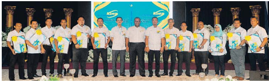
Operasi di ibu pejabat KDEBWM dan kesemua 12 cawangannya menerima pengiktirafan pensijilan ISO 9001:2015 dan 14001:2015 bagi pengurusan kualiti dan alam sekitar baru-baru ini.