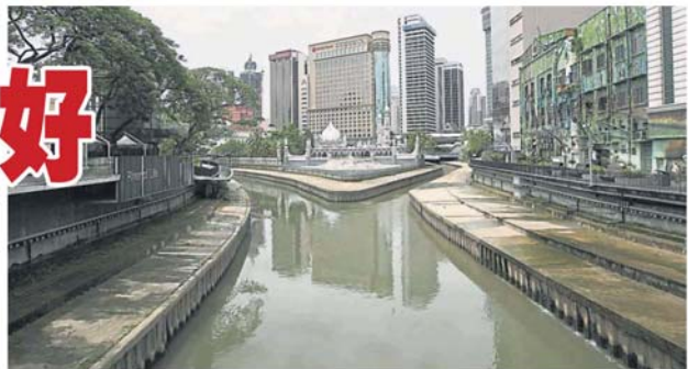
隆市河流都非常干净，不再轻易看到垃圾漂流。